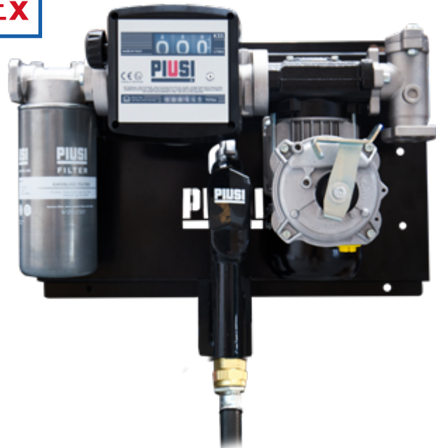
ST PANTHER EX 56, K33, A60 E GASOLINE FILTER

UNSERE PUMPEN BESITZEN DIE FOLGENDEN ATEX-/IECEx-KLASSIFIZIERUNGEN: