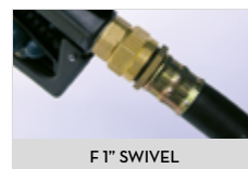
F 1" SWIVEL