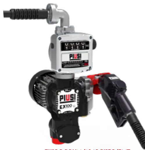
EX100 DRUM /A140/K150/5MT