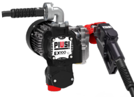
EX100 DRUM /A140/5MT

UNSERE PUMPEN BESITZEN DIE FOLGENDEN ATEX-/IECEx-KLASSIFIZIERUNGEN: