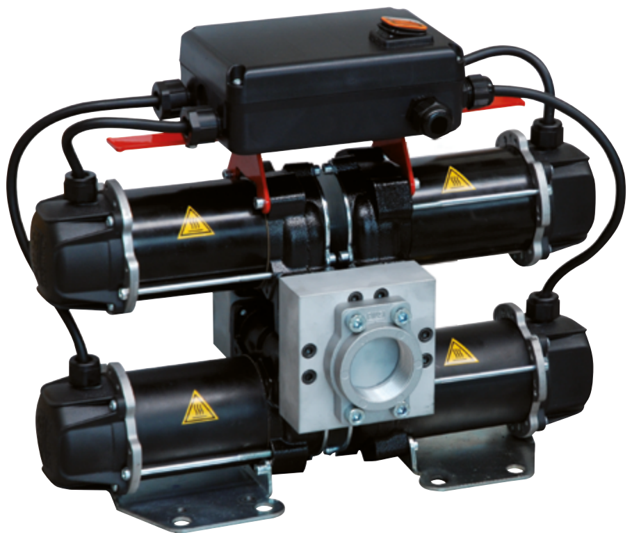
ST 200 DC