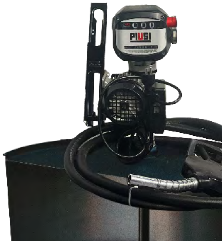
DRUM PANTHER 56 K90