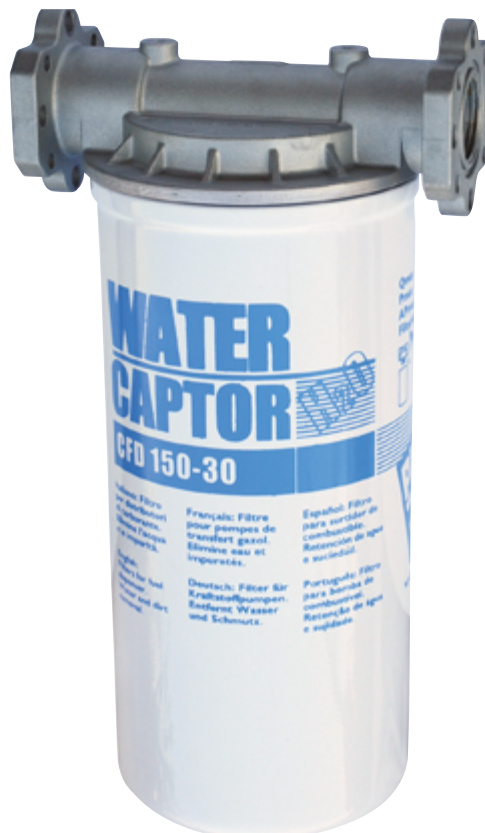
WATER CAPTOR 150 L/MIN