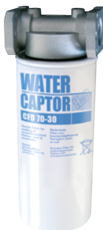
70 L/MIN WATER CAPTOR MIT WASSERABSORPTION