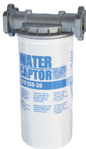
150 L/MIN WATER CAPTOR MIT WASSERABSORPTION