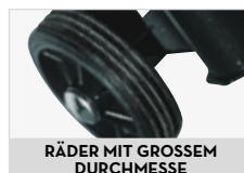
RÄDER MIT GROSSEM DURCHMESSE