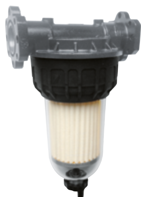
CLEAR CAPTOR WATER FILTER MIT WASSERABSORPTION