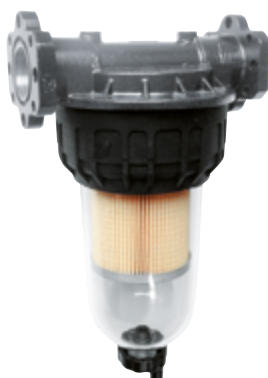
CLEAR CAPTOR FILTER