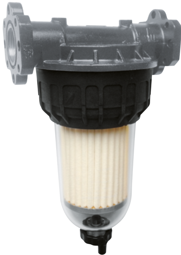
CLEAR CAPTOR WATER FILTER MIT WASSERABSORPTION