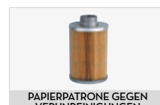
PAPIERPATRONE GEGEN VERUNREINIGUNGEN