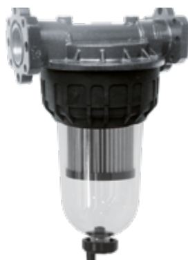
CLEAR CAPTOR STRAINER